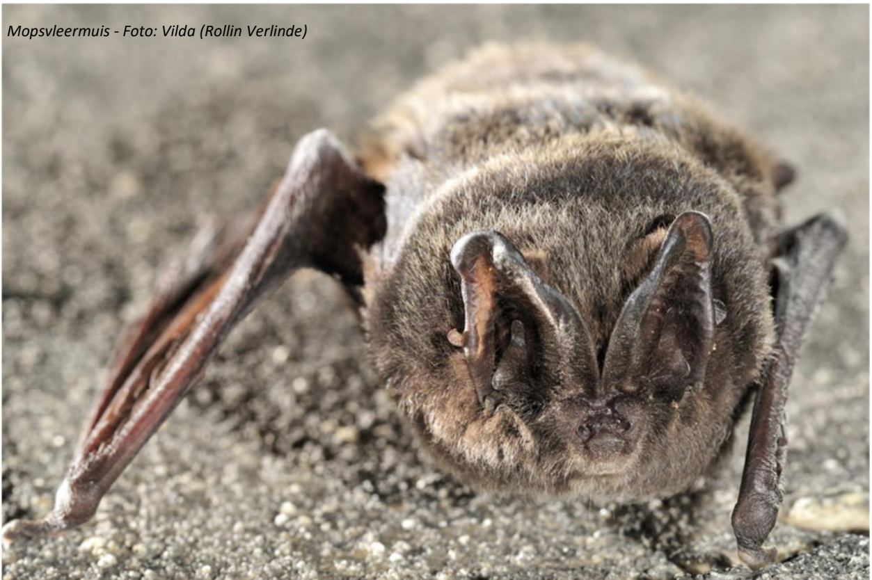
Mopsvleermuis - Foto: Vilda (Rollin Verlinde)

Maar net zoals bij sommige vogels is het bij heel wat vleermuizen gemakkelijker om ze te herkennen aan de hand van hun geluid. Vleermuis-geluiden verschillen wel dag en nacht van vogel-geluiden. Terwijl vogelgeluiden dienst doen voor communicatie en om een territorium af te bakenen gebruiken vleermuizen hun geluid ook om voorwerpen en hun omgeving te lokaliseren zodat ze in het donker kunnen vliegen en jagen. Bij deze 'echolocatie' worden, voor de mens niet hoorbare, hoogfrequente geluiden uitgestoten. Met een speciale bat detector kunnen die wel omgezet worden naar een voor ons hoorbaar geluid.