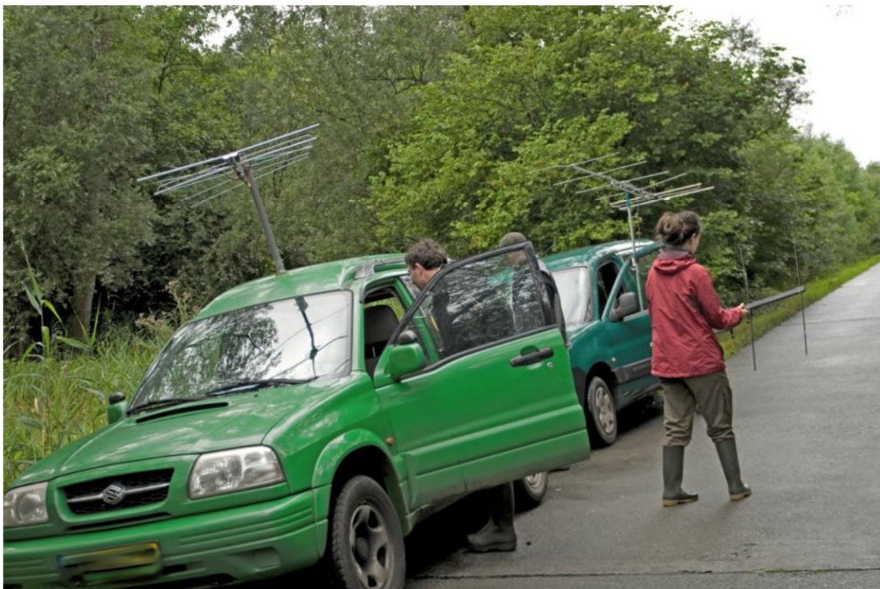
De bat-mobielen op zoek naar signalen van gezenderde Mopsvleermuizen