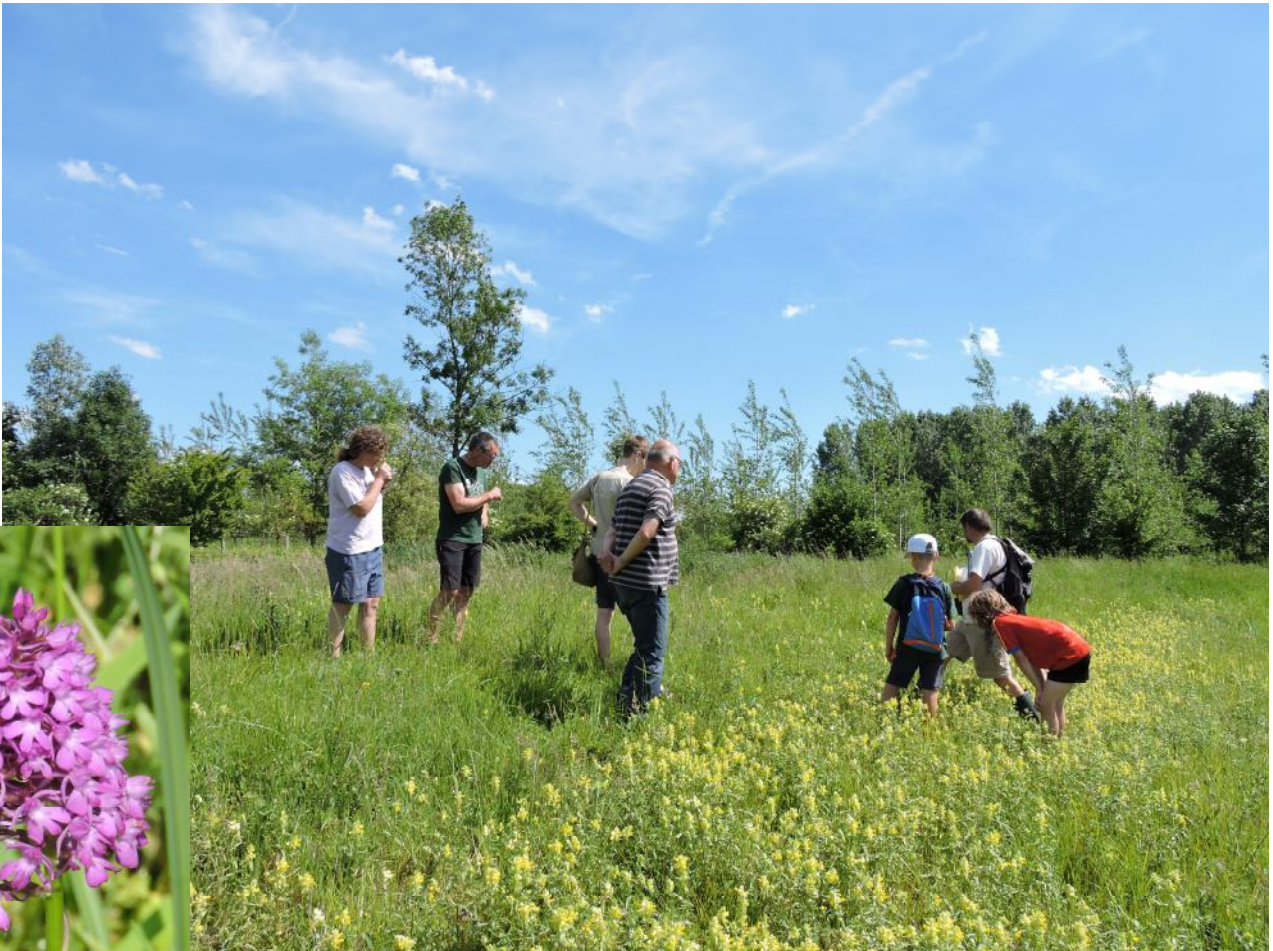
In de Turfmeersen bloeiden begin juni 130 rietorchissen. Er werd ook een zeldzame orchidee gevonden: hondskruid.